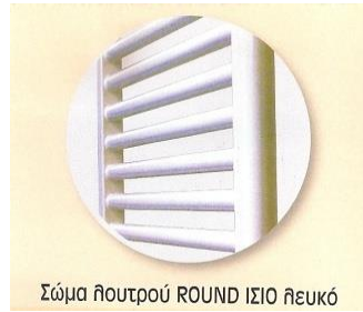
Σώμα λουτρού ROUND ΙΣΙΟ λευκό