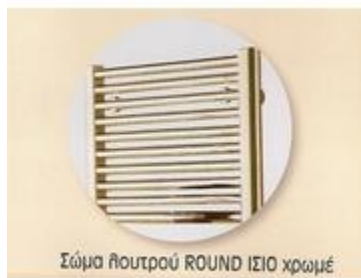
Σώμα λουτρού ROUND ΙΣΙΟ χρωμέ